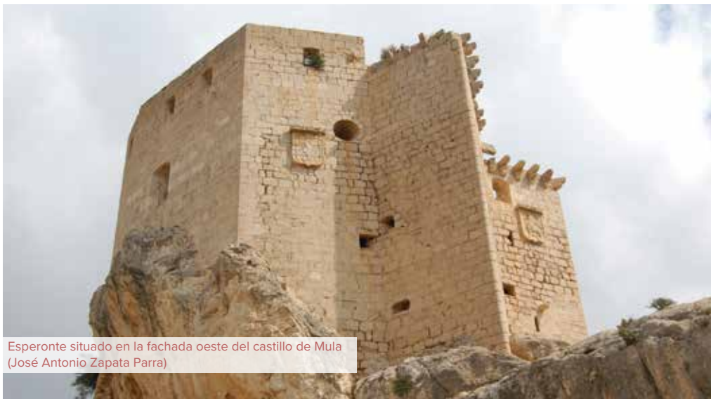
Esperonte situado en la fachada oeste del castillo de Mula (José Antonio Zapata Parra)