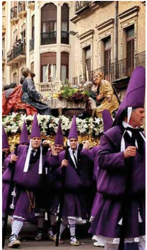
La Santa Cena a su paso por la plaza de Santo Domingo

Clausura de las XXVI Jornadas de Patrimonio Cultural de la Región de Murcia.