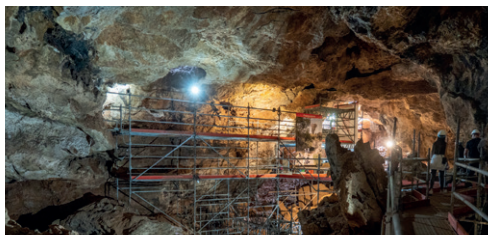
Área paleontológica en Cueva Victoria I con los andamios para trabajo y acceso. Autor: Felipe García Pagán. Ayto. de Cartagena.