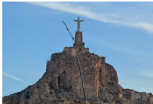
Castillo de Monteagudo. Montaje de andamios en el frente sur. Autor: Francisco José Sánchez Medrano.