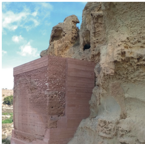
Torre del Agua, en Aledo, después de la restauración. Autor: José Antonio Sánchez Pravia.

VUELTA EN AUTOBÚS A CARTAGENA CON PARADA EN MURCIA (PLAZA DE LA OPINIÓN), SOBRE LAS 20:15 H.