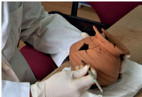
Yacimiento Cobatillas la Vieja. Proceso de restauración de la urna de la tumba 1. Autor: Miguel Pallarés Martínez.

VUELTA EN AUTOBÚS A CARTAGENA CON PARADA EN MURCIA (PLAZA DE LA OPINIÓN), SOBRE LAS 20:15 H.