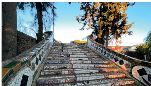
Huerto de las Bolas. Mirador sobre la carretera nacional. Autora: María José Muñoz Mora.