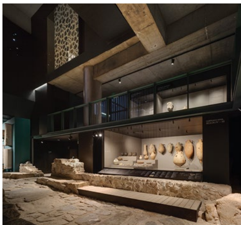
Museo Romano del Foro, Cartagena.