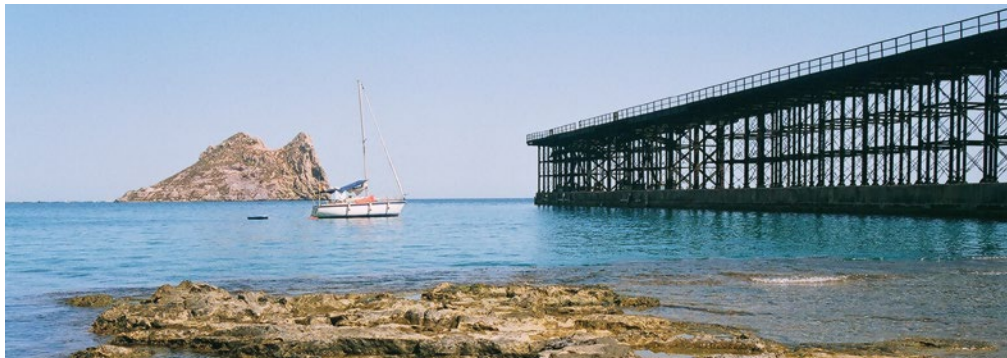
Embarcadero del Hornillo e isla de Fraile, Águilas.

VUELTA EN AUTOBÚS A CARTAGENA CON PARADA EN MURCIA (PLAZA DE LA OPINIÓN), SOBRE LAS 20:30 H.